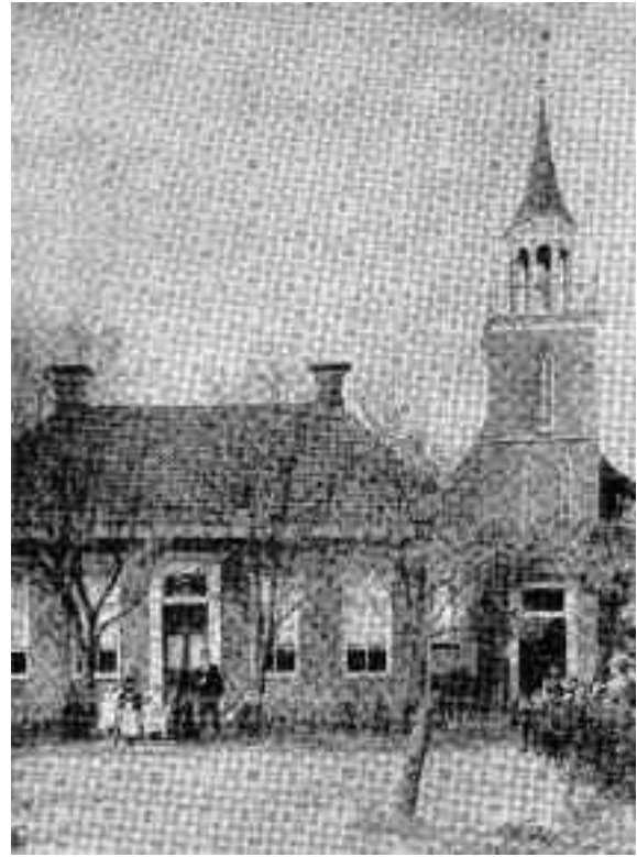
Afb. 4, De in 1890 afgebroken oude pastorie naast de in 1865 herbouwde Lutherse kerk

ber 1830 werd ingeschreven. In zijn laatste studiejaar liet hij zich op 24 september 1832 nog te Leiden inschrijven om er kort daarna, op 19 oktober 1832 met goed gevolg het proponenten-examen af te leggen.