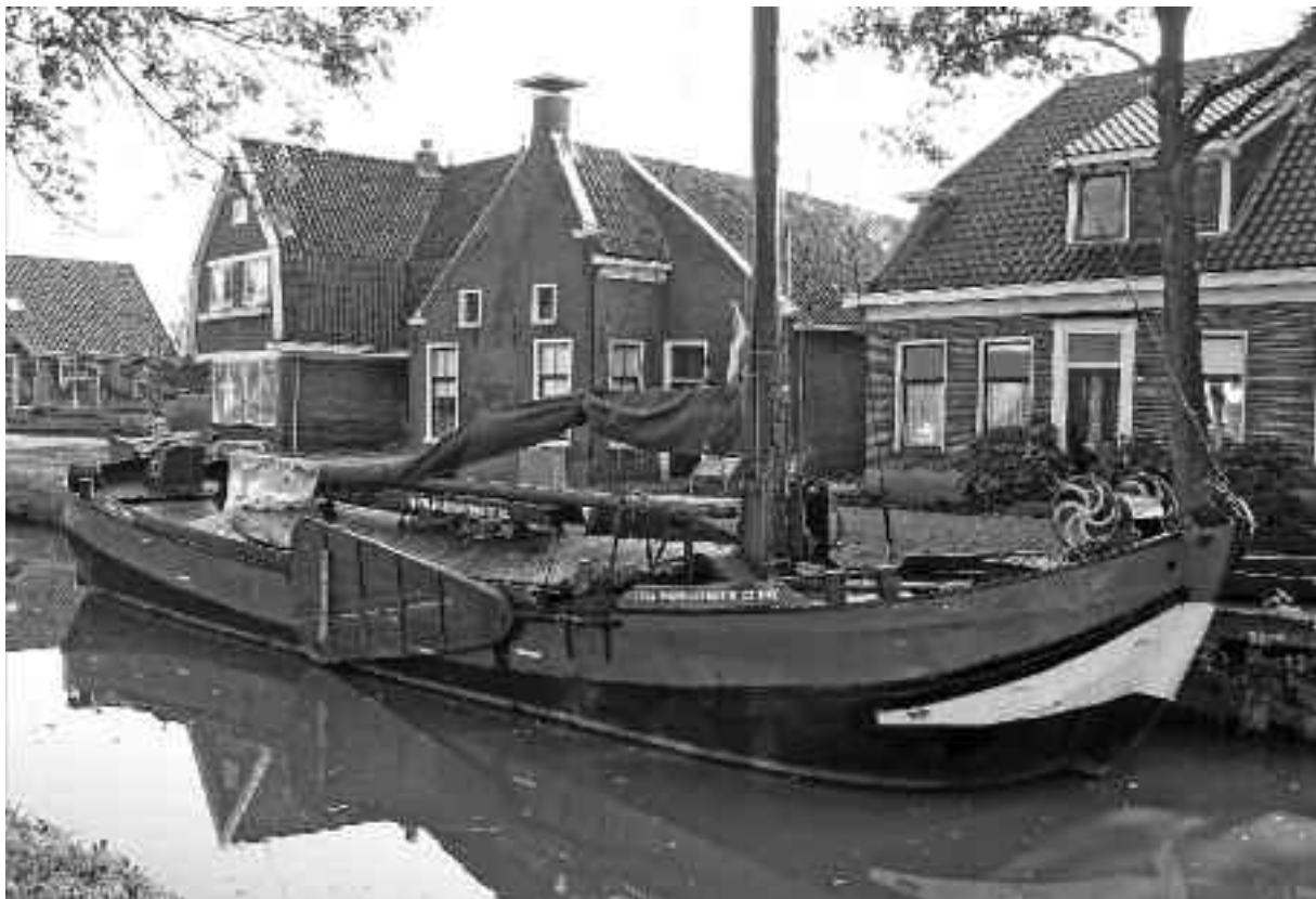
Het Kapiteinshuis met het schip "Familietrouw"

Het bruikleen van het scheepsportret van de schoener Stad Appingedam, dat sinds 2003 in het museum werd geëxposeerd, werd door de eigenaar beëindigd.