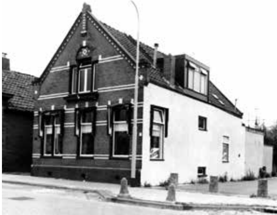
Het kantoorgebouw van touwfabriek "De Volharding", aan de W.H.Bosgrastraat 40 te Oude Pekela.