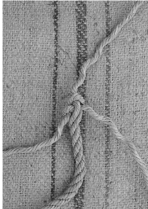
#) in: Jaarverslag Kapiteinshuis 1998