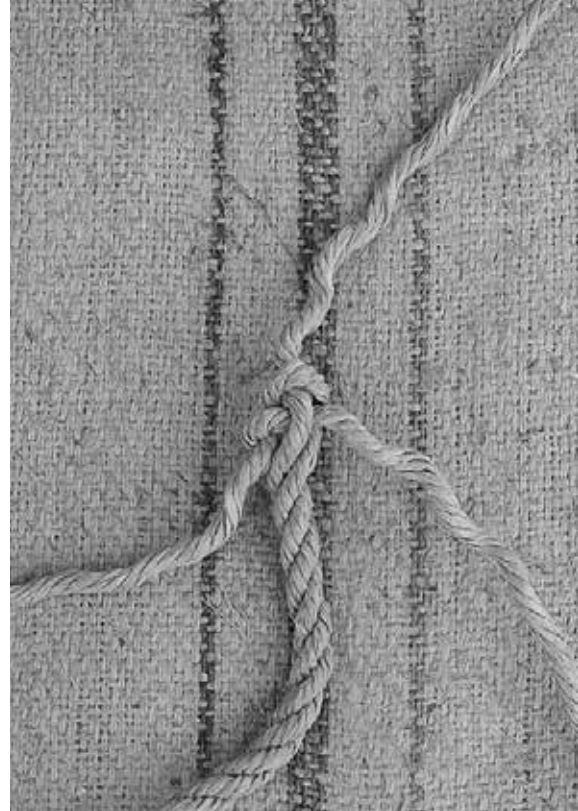
#) in: Jaarverslag Kapiteinshuis 1998