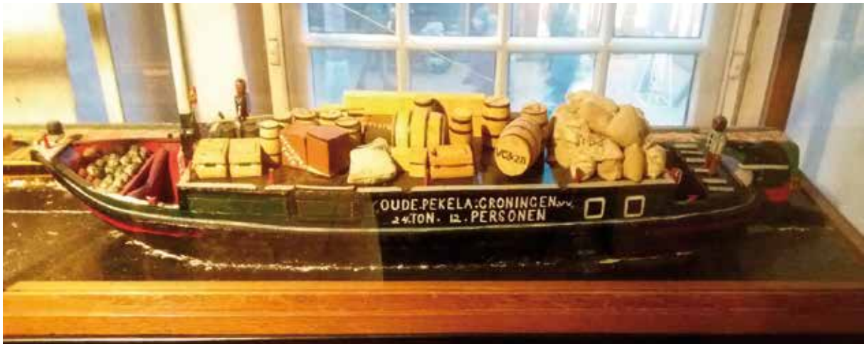
Model van een snik of trekschuit zoals in gebruik rond 1900, gemaakt door beurtschipper H. Kraan te Oude Pekela. (Collectie: Museum aan de A, Groningen)

Tot ver in de 2e helft van de 19e eeuw was in de Veenkoloniën, bij gebrek aan begaanbare wegen, het vervoer over het water relatief snel en aangenaam. Voor personenvervoer was de snikke het meest geëigende transportmiddel. Voor goederenvervoer werd gebruik gemaakt van beurtschepen. In Groningen, met de stad als overstap/slagplaats, bestond een strak vaarschema voor schippers met door de stad Groningen, later de gemeenten, afgegeven vergunningen en ook, tot in detail, vastgestelde tarieven. Vreemde schippers mochten zich niet bemoeien met de veer- en beurtvaart. Dit op straffe van fikse boetes. De gezamenlijke snikkevaarders van Oude en Nieuwe Pekela lieten belanghebbenden op 25 september 1829 per advertentie weten dat goederen naar Pekela kunnen worden bezorgd bij 'de Nieuwe Karper' voor Kleinpoortje opdat de goederen niet door berggelden worden bezwaard.