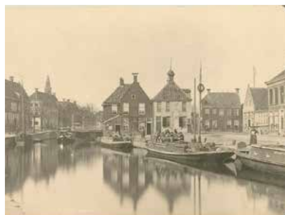
Voormalig Klein Poortje, Groningen. J.G. Kramer ca. 1885

Na de 2e wereldoorlog werd ook de beurtvaart overgenomen door het wegtransport. De boderijders vervoerden nog jarenlang via vaste routes hun vrachten naar Groningen. Niet meer naar het Klein Poortje maar nu naar het 'Bodenterrein' aan het Oosterhamrikkanaal; de overslag-