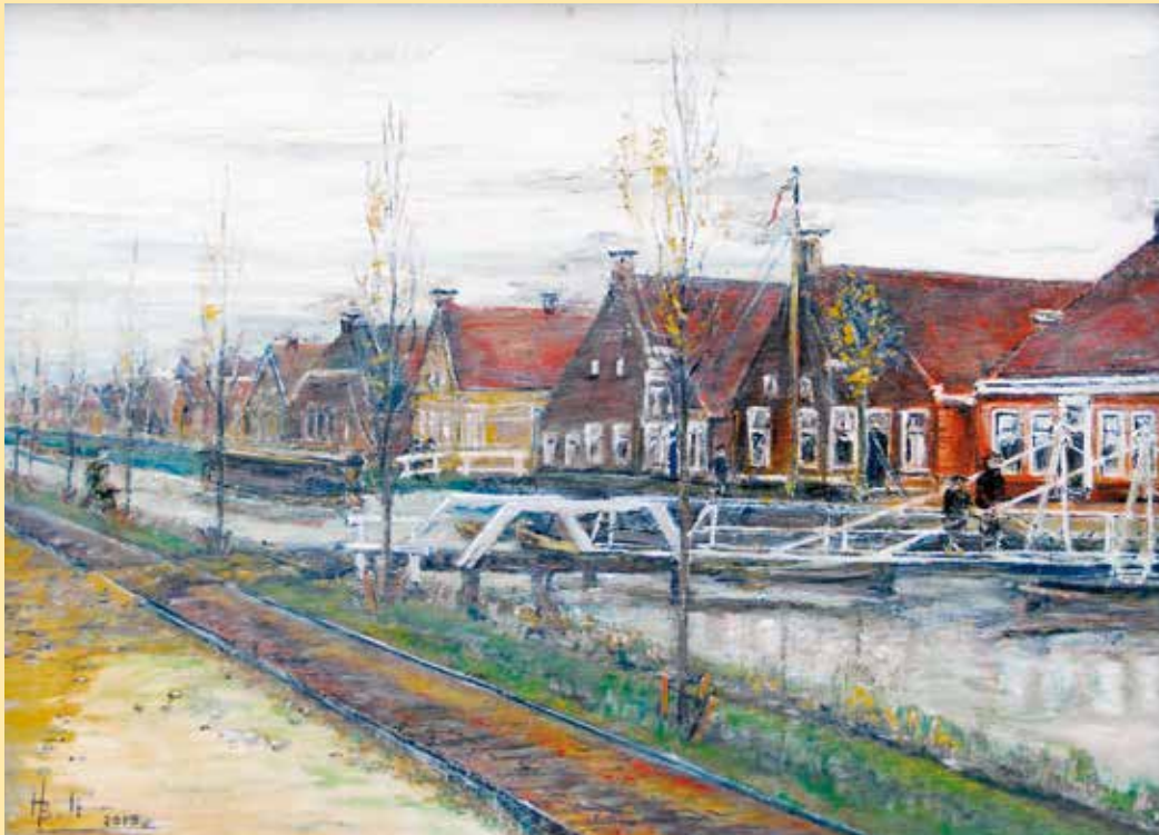
Wisselschilderij, van de hand van Henk Bult, aangeboden tijdens de Kapiteinslezing op 5 november 2022.