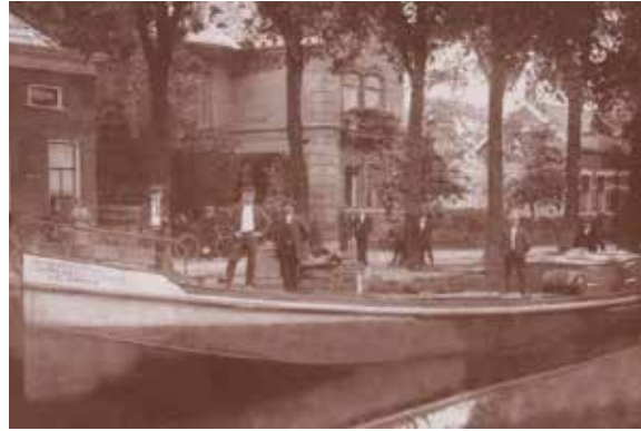
Beurtschip 'Pekel A'